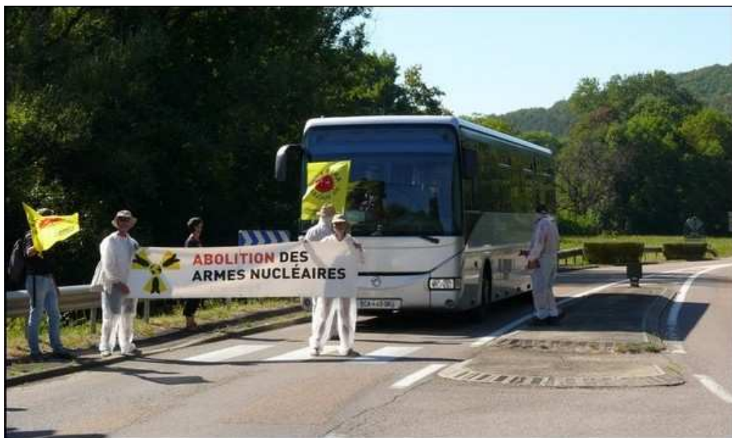
Arrêt d'un bus de salariés du CEA et tentative de remise du dépliant Calduc, 7 août 2020