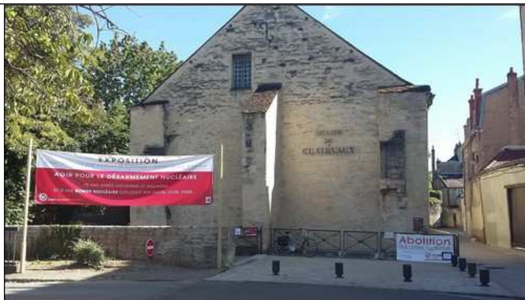
Exposition 'Agir pour le désarmement nucléaire', Cellier de Clairvaux à Dijon, 31 juillet au 9 août 2020