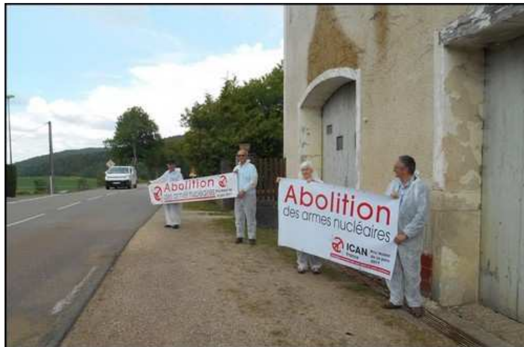
Vigie citoyenne à Frénois, 11 juin 2020