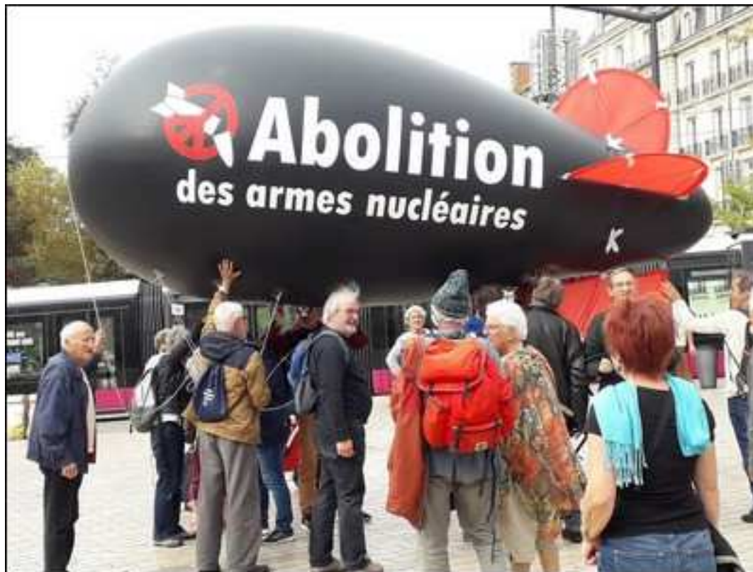
Action sur la place Darcy à Dijon, 14 octobre 2018

Manifestation à 11 h devant le CEA Valduc. Après-midi, place Darcy à Dijon : le ballon gonflable est porté par 8 militants. Prises de paroles et concert.