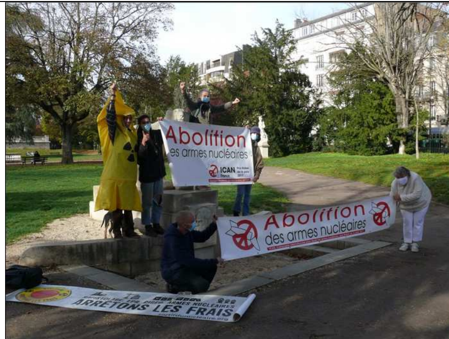
devant l'ours de François Pompon dans le parc Darcy