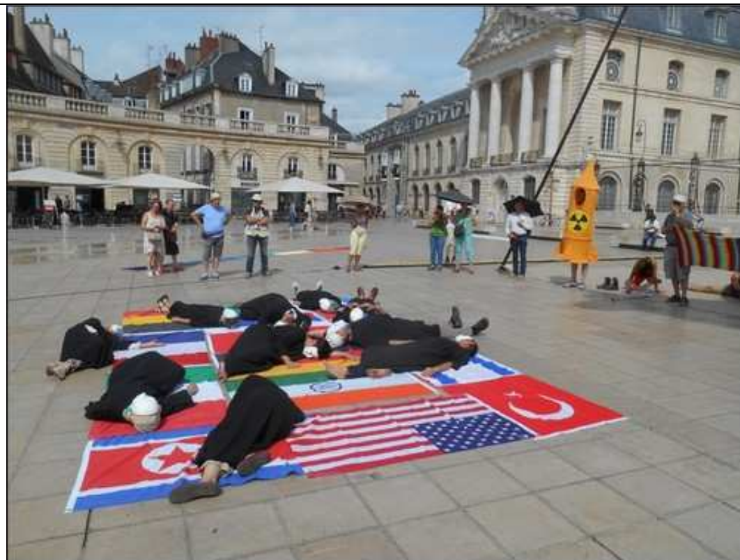
Die-in sur la Place de la Libération devant la Mairie de Dijon, 9 août 2019