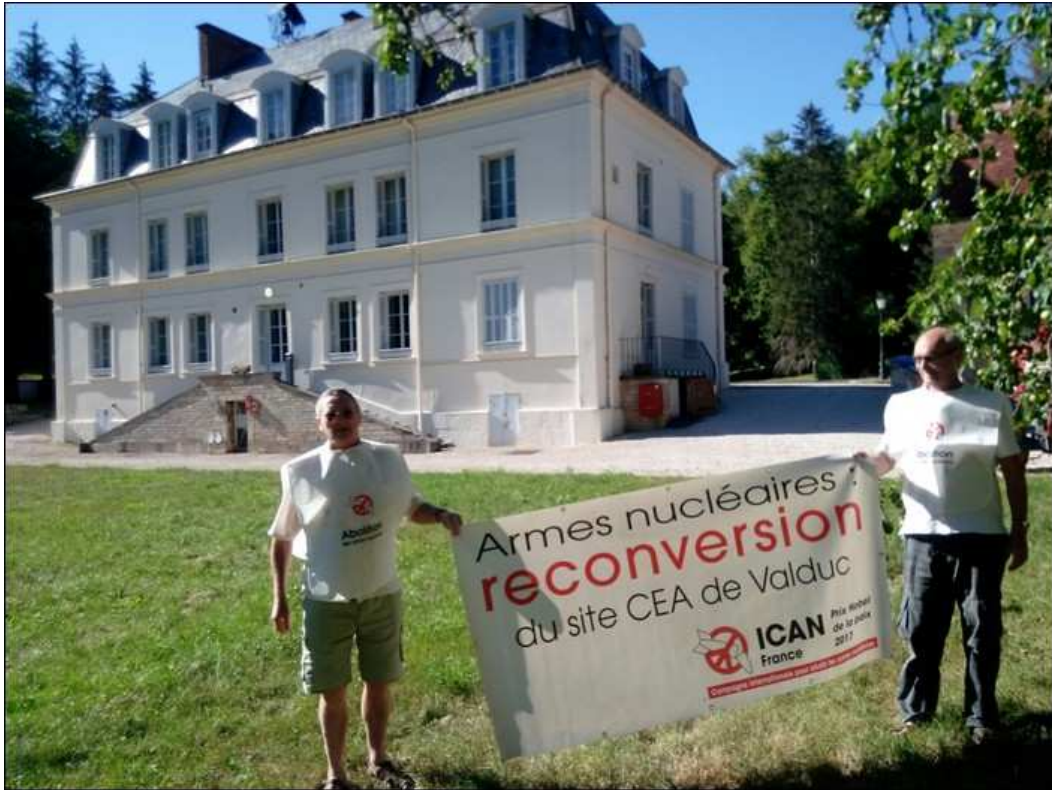
Intrusion de 3 lanceurs d'alerte dans la partie non sécurisé du site de Valduc, 'le Château,' 9 juillet 2020